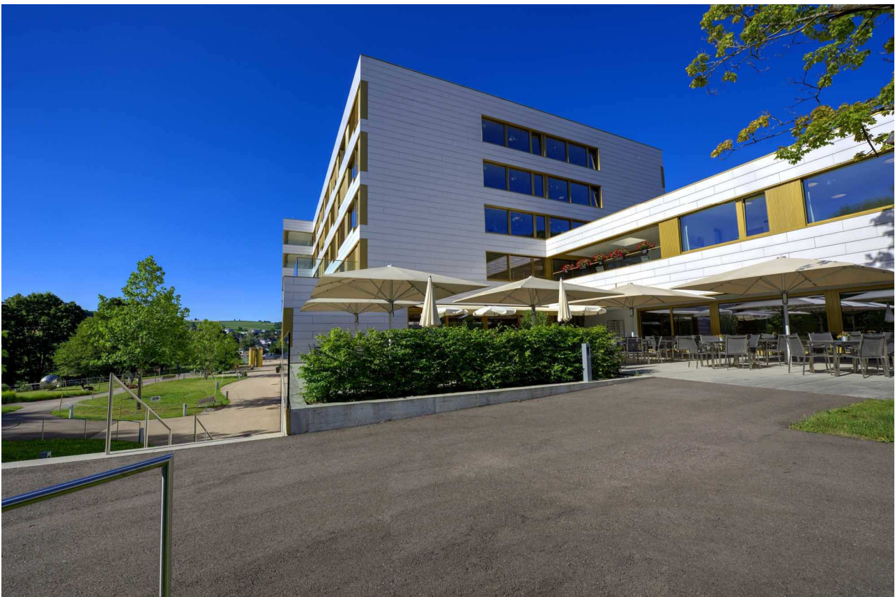
Bild: Seniorenzentrum GRITT Waldburgertal von aussen